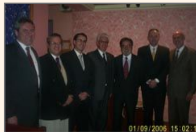
El Embajador acompañado del Directorio de la Cámara