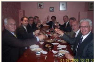
Brindis con el Embajador