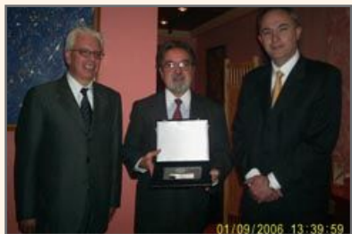
El Embajador mostrando su reconocimiento junto al Presidente y Gerente de la Cámara