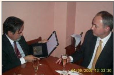
Entrega Reconocimiento grabado en vidrio por el Presidente de la Cámara