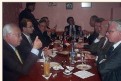
Vista general de la mesa