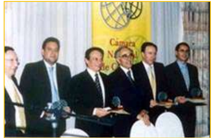
Los galardonados posan con sus distinciones junto al Embajador del Brasil y el Presidente de Directorio.