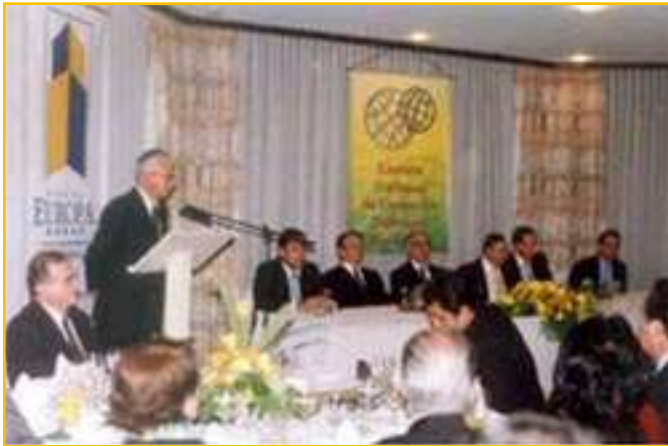
El Gerente General de la Cámara da inicio al evento.

YPFB, institución que fue creada para beneficio de los bolivianos, y que tuvo que pasar por diferentes procesos, hoy es una empresa que ha renacido de sus cenizas, fuerte y renovada, es por tal razón que la Cámara Nacional de Comercio Boliviano Brasileña le confieren la distinción de Empresa Destacada 2006